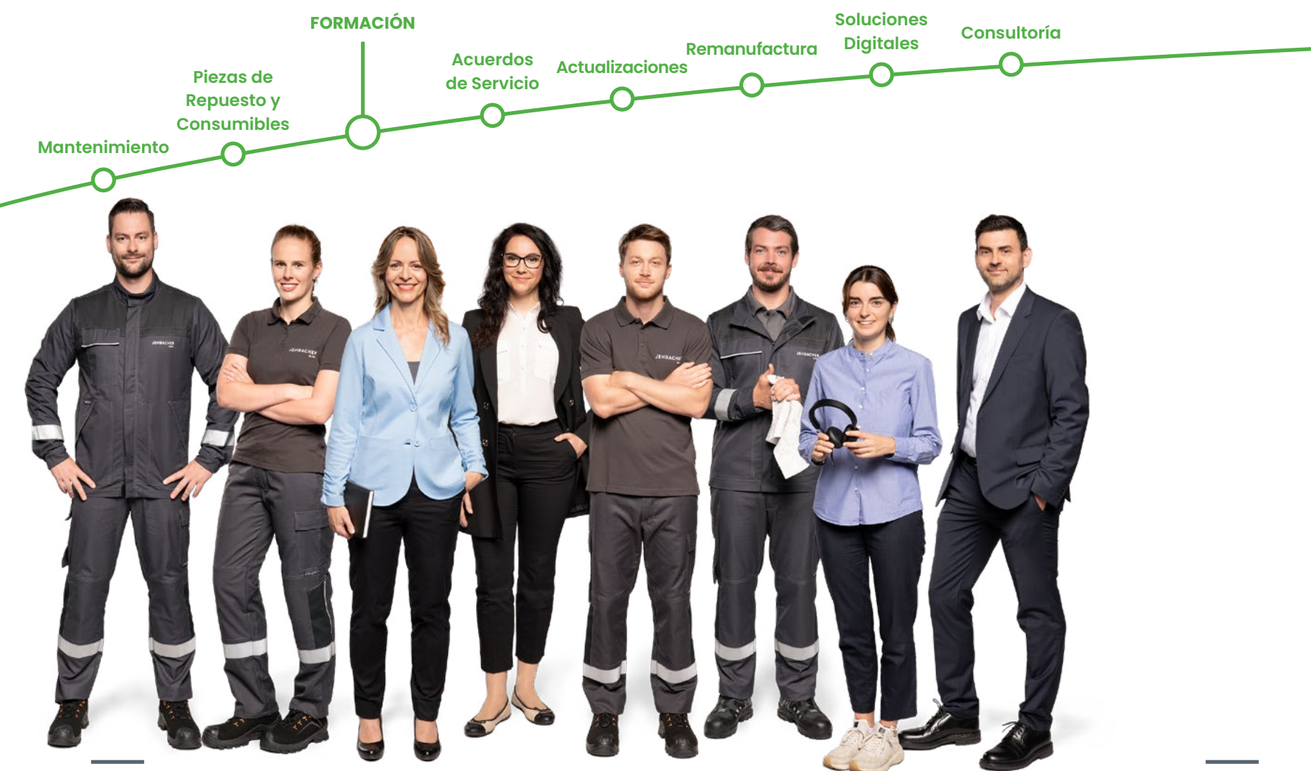
El equipo de Jenbacher Services

El equipo mundial de Jenbacher Services conoce mejor que nadie su sistema de energía. Como fabricante de equipos originales (OEM), el INNIO Group le proporciona un conjunto completo de soluciones de ciclo de vida, desde piezas originales hasta servicios fiables in situ y remotos, todo gracias a la avanzada tecnología myPlant.