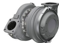
Modifizierter Turbolader 1